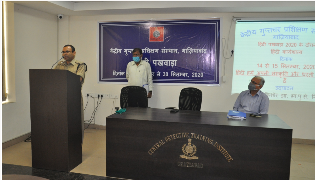
निदेशक के.गु.प्र. संस्थान गाजियाबाद द्वारा हिंदी पखवाड़ा दिनांक 14.09.2020 से 30.09.2020 के दौरान दो दिवसीय हिंदी कार्यशाला का उद्घाटन करते हुए