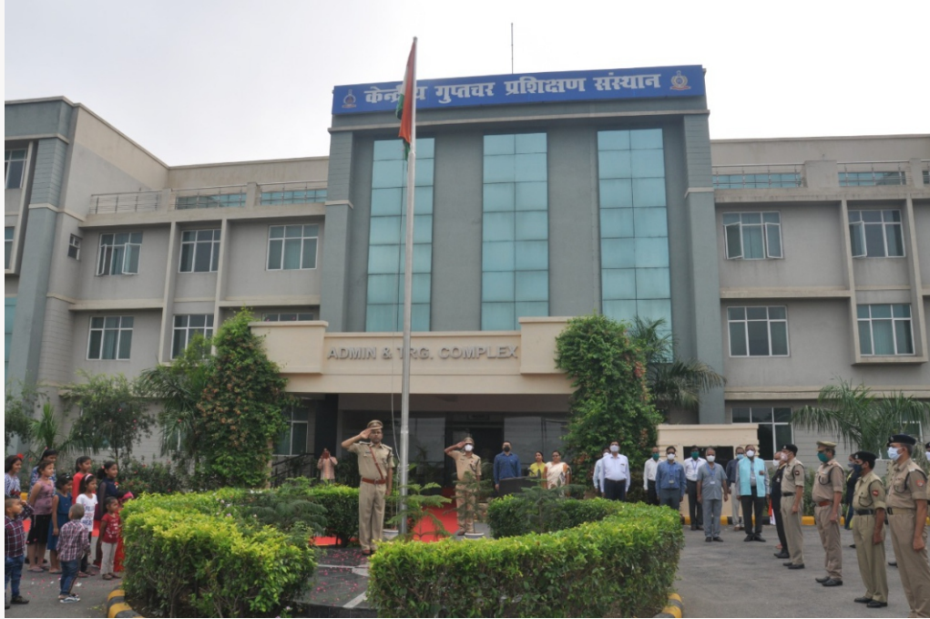
Director CDTI, Ghaziabad hoisting National Flag on the eve of Independence Day on 15 th Aug, 2020.